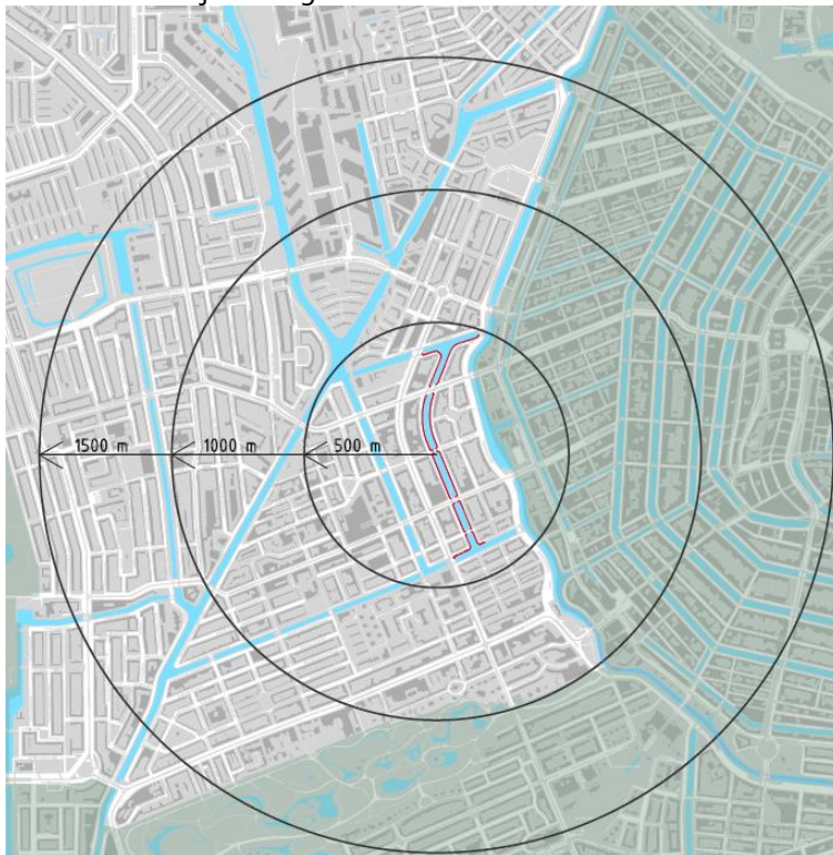
Figuur 2 Zoekgebied tijdelijke wissellocaties

Op onderstaande plattegrond (figuur 2) zijn rondom het middelpunt van de Da Costakade drie cirkels getrokken, elke keer 500 meter verder vanaf het middelpunt van de Da Costagracht. De mogelijke wissellocaties zijn per cirkelgebied onderzocht, vanaf het middelpunt steeds meer naar buiten. Ook locaties in stadsdeel Centrum en Zuid vallen binnen het zoekgebied, maar deze zijn vooralsnog buiten beschouwing gelaten. Stadsdeel Centrum kampt met een zeer hoge gebruiksdruk en weinig openbare ruimte per inwoner. Uitbreiding van tijdelijke wisselplekken is hier ongewenst. Daarnaast vinden er de komende jaren meerdere kademuurvernieuwingen plaats binnen het Centrum, waar in het Centrum zelf tijdelijke wisselplekken voor nodig zijn. De meest voor de hand liggende mogelijkheden voor tijdelijke wisselplekken bevinden zich in stadsdeel West, het stadsdeel waar de Da Costakade zich in bevindt. Dit sluit ook aan bij het Beverprotocol, waarin verplaatsing binnen hetzelfde stadsdeel de voorkeur heeft en waarbij de bestuurlijke verantwoordelijkheid ligt in stadsdeel West.